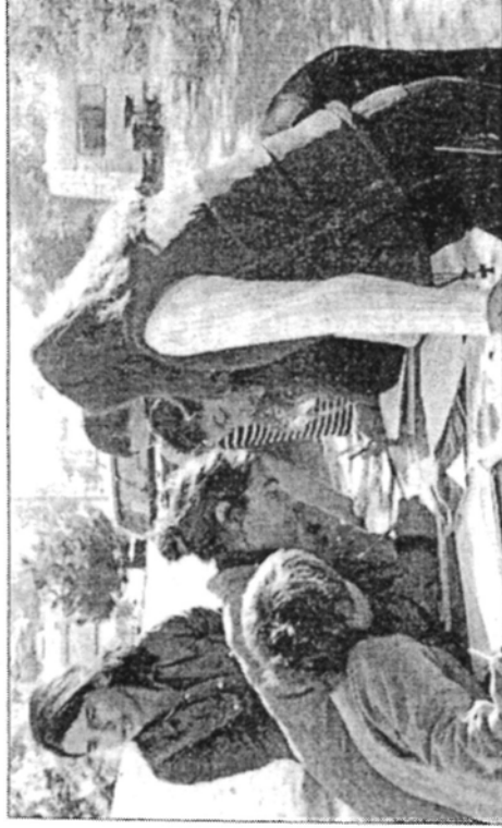
Les enfants peignent leurs caravanes pendant un atelier d'arts plastiques autour du conte animé par l'association.

Depuis 1997, l'association « Art Rom » se bat pour la reconnaissance de l'art tsigane, en montant des projets artistiques réunissant nomades et sédentaires.